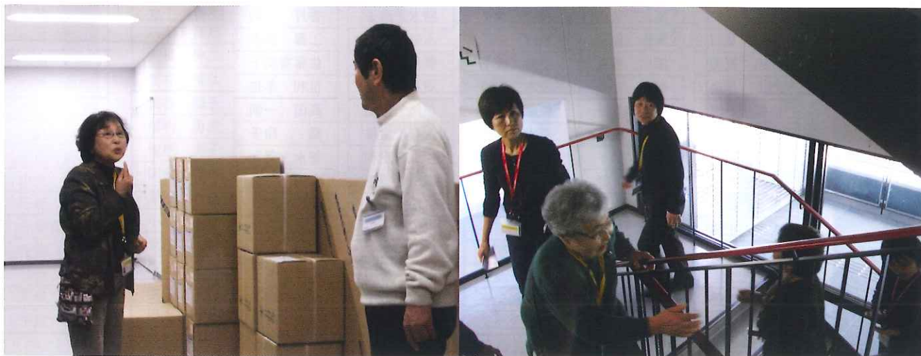
*聴覚障害者と一緒に避難経路確認*

手話通訳活動を通じて、聴覚障害者や手話について一人でも多くの人に理解して頂くという大切な仕事も担っています。