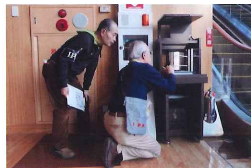
自記温湿度計記録紙交換