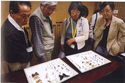
昆虫同定セミナー