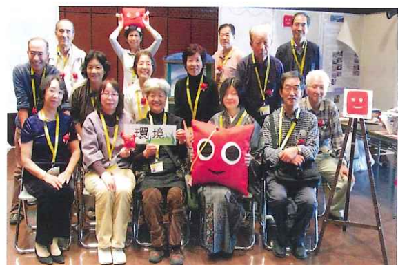
きゅーはくまつり