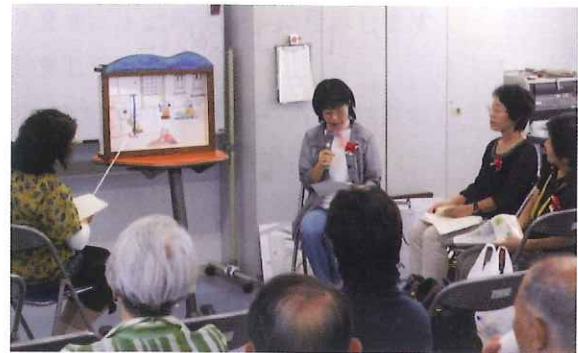
長崎ペンギン水族館との交流