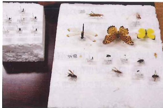
昆虫同定セミナー