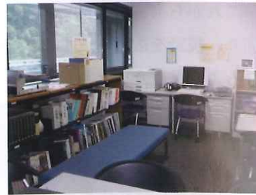
ボランティアルーム