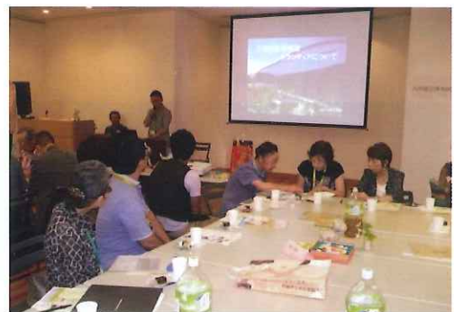
大分市美術館 交流会

これからも、積極的に外部との交流、ネットワークの拡大構築を図り、視野を広げると共に、そこで得たものが、さらなる架け橋となるよう繋げたいと思います。