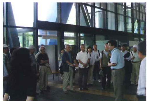
伊都国歴史博物館 来館交流会