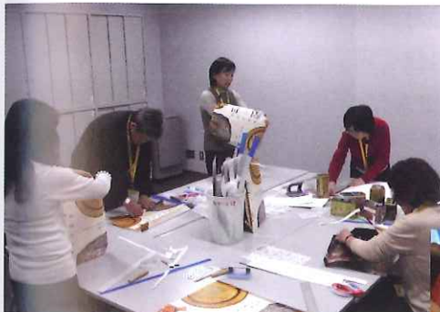
アートエコバッグ作成風景