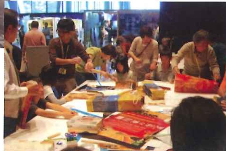
子どもフェスタワークショップ風景