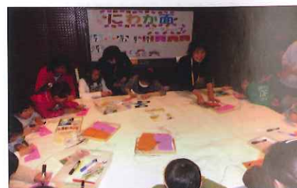
九博子どもフェスタ