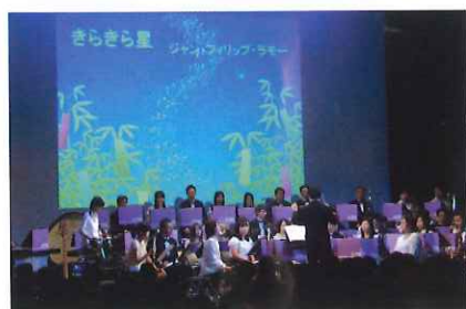
まほろばコンサート